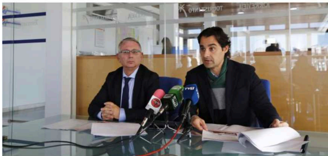
El Teatro de Torrevieja acogerá el Congreso Internacional de Turismo Deportivo