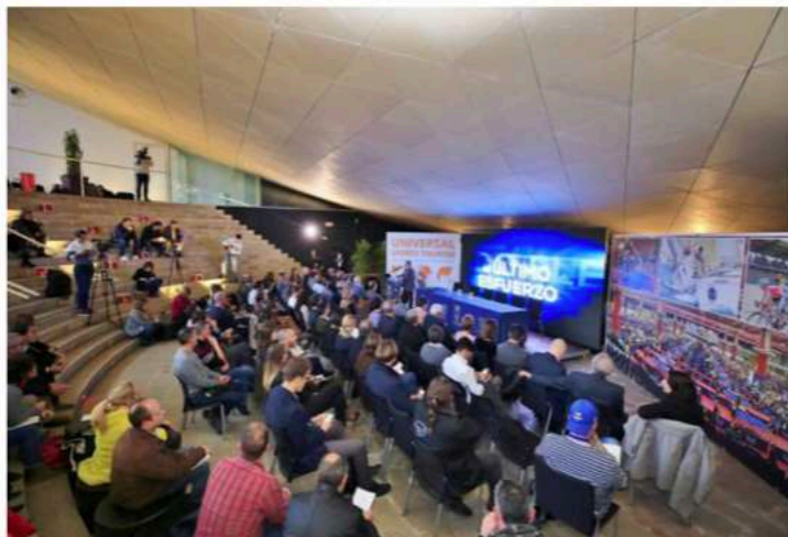
Inauguración del evento.